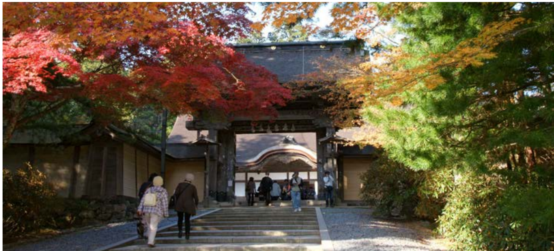
Hojas de otoño (Momiji) en Kong bu-ji, Monte Koya. Declarado Patrimonio de la Humanidad

Las calles de Japón se ponen rosadas en septiembre. Toda la nación espera la floración de los cerezos. Es una de las épocas más lindas para el pueblo nipón.