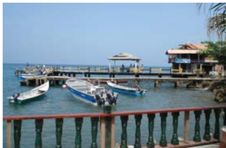
Puerto de Capurganá

El transporte local es mediante carretas jaladas por burros, bicicletas y caballos, no hay carros, es como regresar en el tiempo. Esperemos que la información que le hemos dado de Capurganá, terrenos con vista al mar, vivir en Capurganá, vista al mar Capurganá, bienes y raíces Capurganá incrementara su interés.