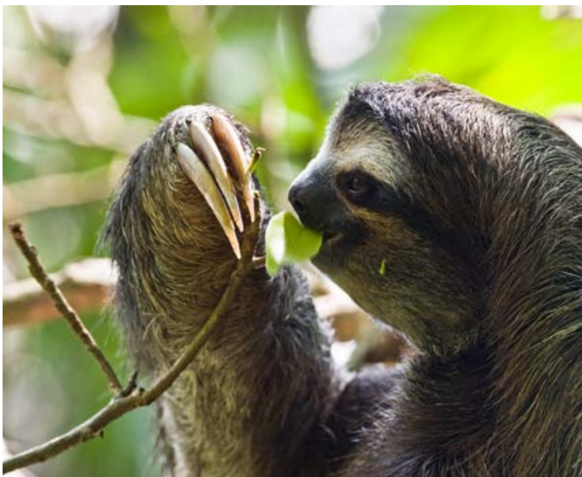
Entre los animales que habitan La Gorgona se encuentra el Perezoso bayo.

A lo largo de Gorgona se encuentran diferentes sitios de inmersión clasificados de acuerdo con su exigencia. Los puntos de buceo varían según su ubicación: las aguas frente a la costa colombiana son más tranquilas, ideales para principiantes, mientras que las aguas en mar abierto —mucho más brías— son propicias para buzos de mayor experiencia. Los principales puntos de inmersión de la isla son: El Remanso, La Tiburonería, la Plaza de Toros, Montañitas, La Cazuela, entre otros.