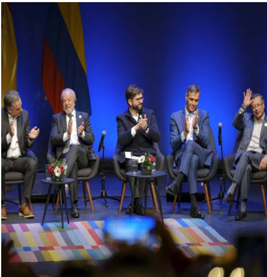
Los cinco presidentes progresistas de Hispanoamérica, sostuvieron un encuentro con la sociedad civil.

Desde España, Pedro Sánchez hizo un llamado a «actuar unidos» para «pasar a la ofensiva» contra la «internacional del odio que pone en riesgo a la democracia». Sánchez definió la preservación democrática como un «deber moral» y una «deuda con las generaciones futuras», proponiendo tres tareas