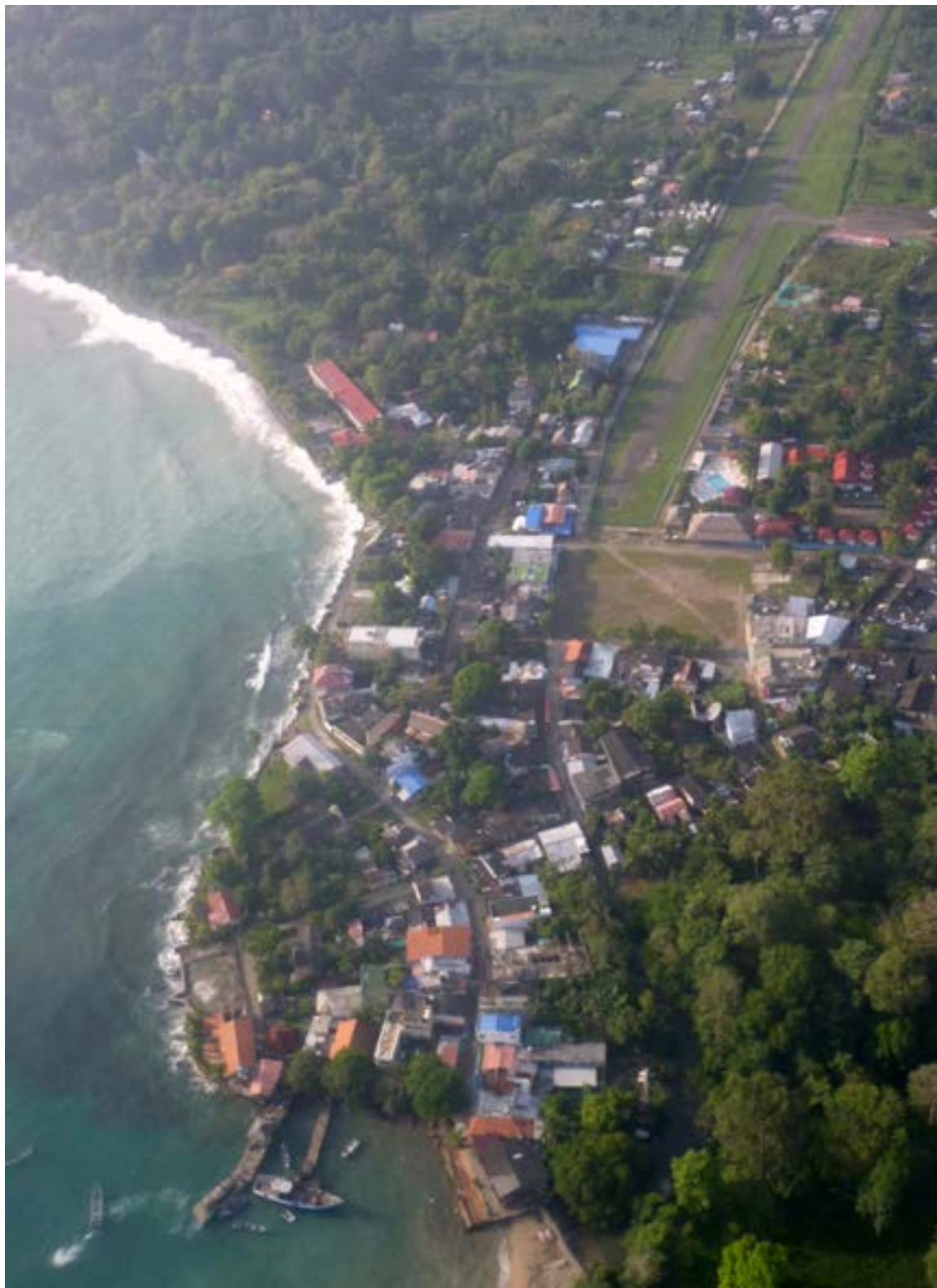
Capurganá vista aérea