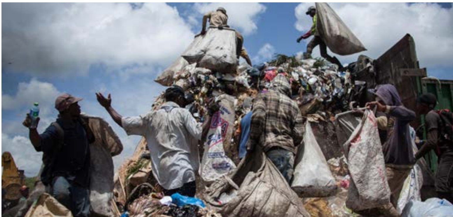
San Cristóbal enfrenta una lucha silenciosa contra la basura dispersa en puntos críticos. Aunque sin un gran botadero visible, la acumulación de residuos afecta la vida diaria. La desidia ciudadana y la necesidad de colaboración son evidentes.

En algunos barrios, la persistencia de estas malas prácticas ha engen-