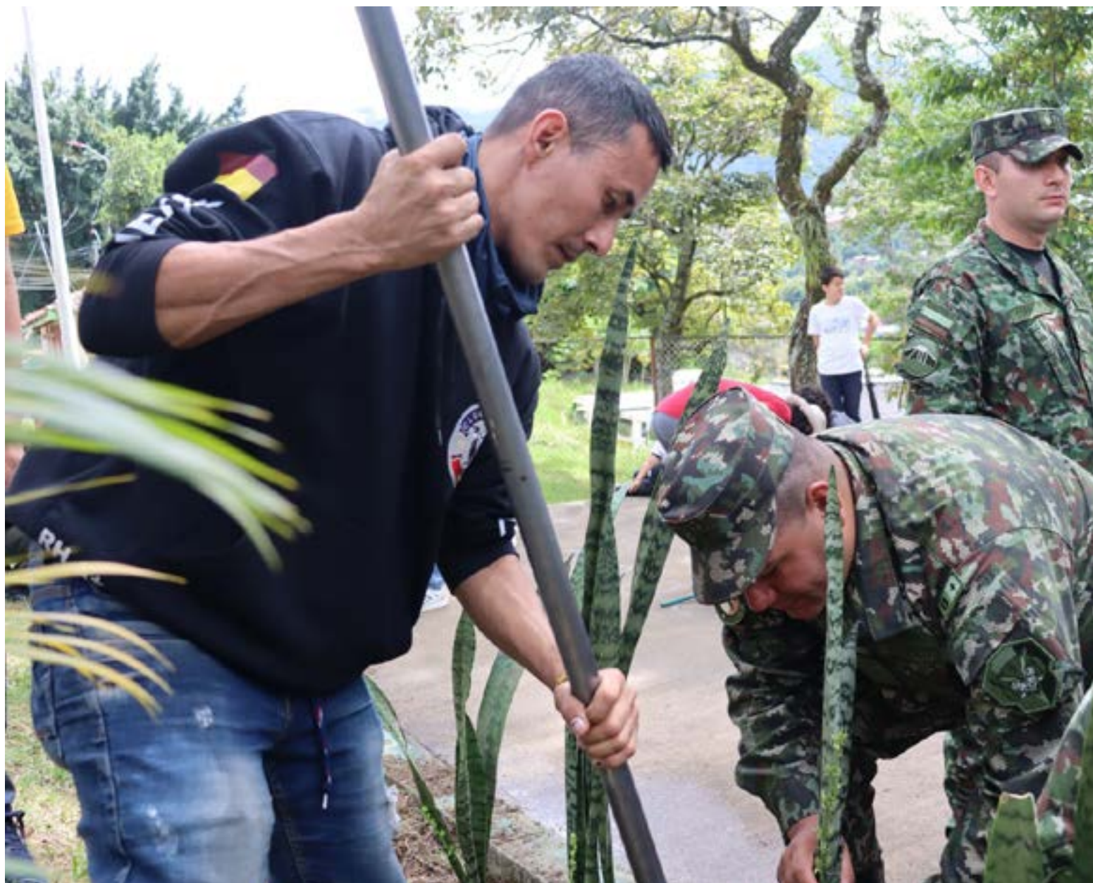
La jornada, que se desarrolló en un ambiente de cooperación, alegría y un palpable sentido de pertenencia, incluyó labores de pintura, adecuación de zonas verdes y recuperación de estructuras.

Estas acciones conjuntas ratifican el compromiso del Ejército Nacional, la Policía Nacional y diversas entidades privadas con el fortalecimiento del tejido social, la creación de entornos más seguros y, en última instancia, con el bienestar general de las comunidades en Ibagué.