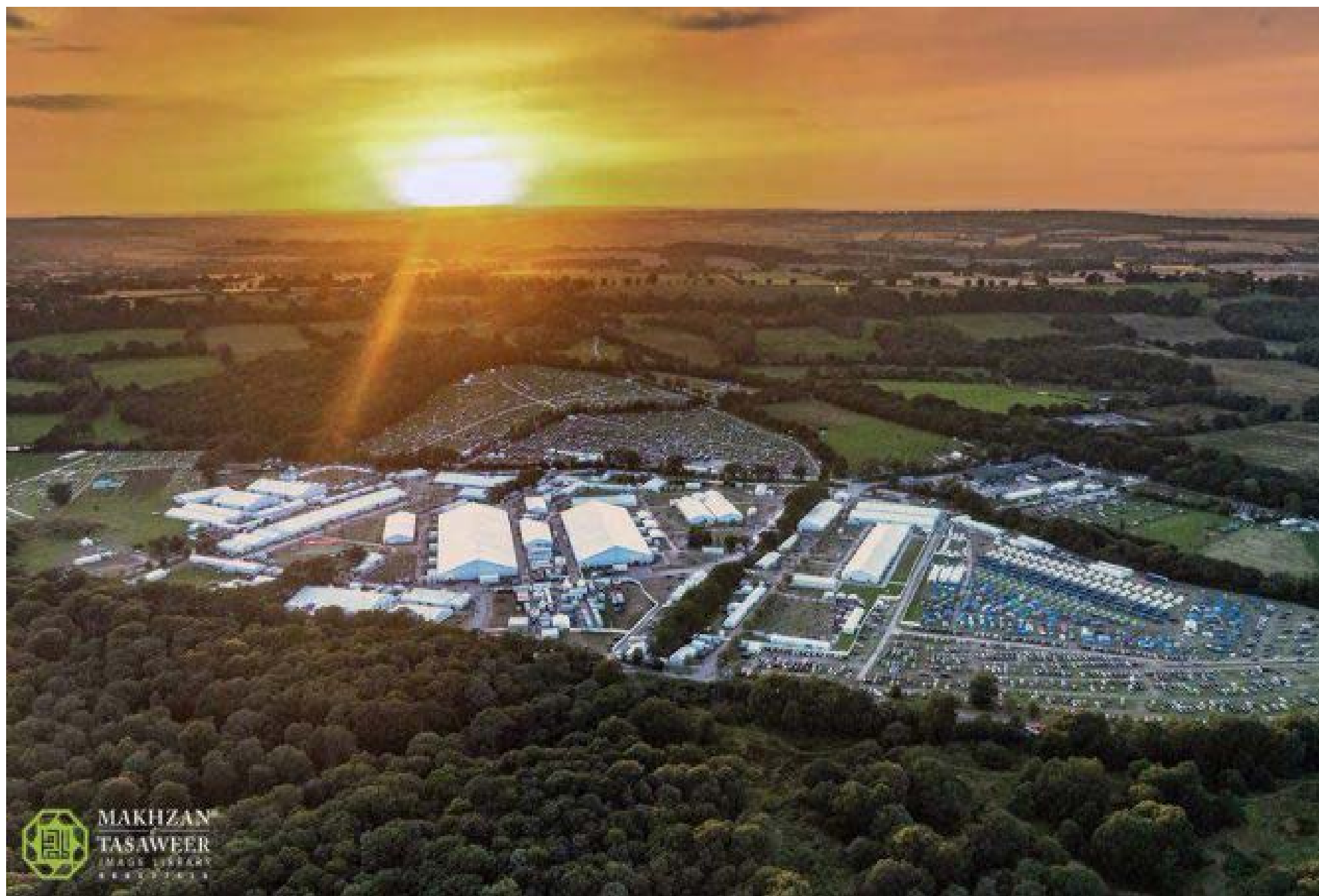
El Yalsa Salana en Hadeeqatul Mahdi, Alton, Hampshire, Reino Unido, es una reunión anual de la Comunidad Musulmana Ahmadía. Se celebra en el recinto conocido como Hadeeqatul Mahdi