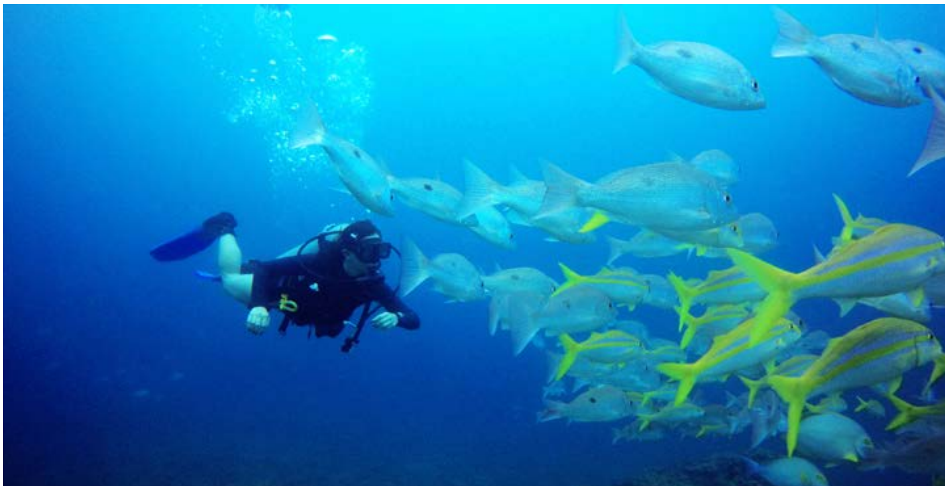
El buceo en Gorgona no es sólo una actividad pasiva de contemplación, pues sus aguas ofrecen aventuras subacuáticas a través de rutas que presentan paisajes exóticos y una fauna multicolor.

es sólo una actividad pasiva de contemplación, pues sus aguas ofrecen aventuras subacuáticas a través de rutas que presentan paisajes exóticos y una fauna multicolor. El buceo en Gorgona es una actividad de bajo riesgo gracias a las condiciones tranquilas de las corrientes marinas de la isla, las cuales son ideales tanto para la práctica como para el aprendizaje del buceo.