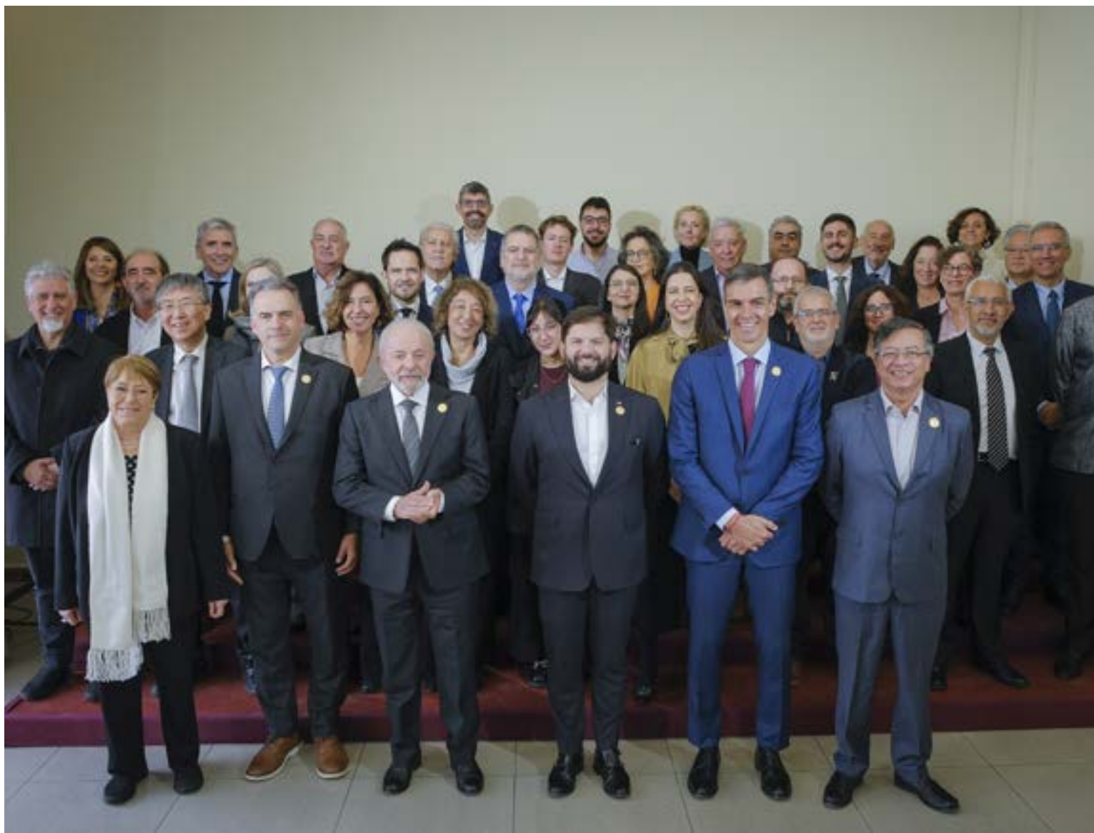
En Santiago de Chile, hubo un encuentro entre los presidentes progresistas con intelectuales y académicos.

El presidente de Colombia, Gustavo Petro, alertó sobre una «crisis de la multilateralidad» y enfatizó la necesidad de que «cuando las tinieblas llegan, el progresismo debe juntarse». Por su parte, Yamandú Orsi, mandatario de Uruguay, centró su intervención en la urgencia de «fortalecer la convivencia», instando a «evitar los extremismos y la pérdida de credibilidad en la democracia» y a generar una propuesta basada en «libertad, igualdad y democracia».