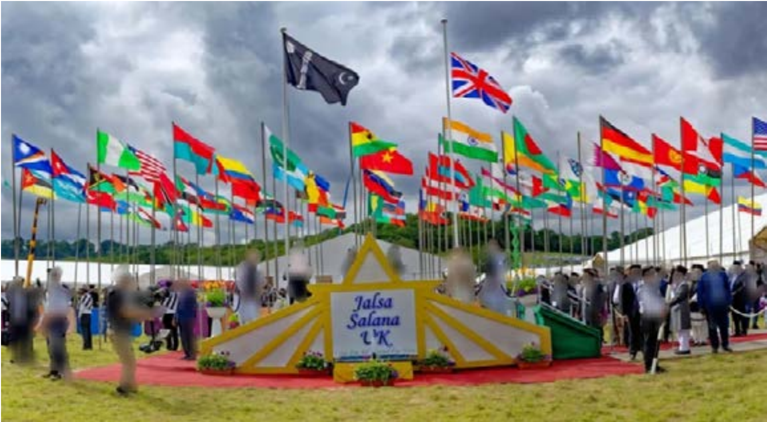
Yalsa Salana, Alrededor de 100 banderas de diferentes países exhibidas en la Convención Anual de la Comunidad Musulmana Ahmadíá en Reino Unido]

La recompensa y el beneficio espiritual son, sin duda, lo que distingue a esta asamblea de otras convenciones seculares. La dedicación y el espíritu de voluntariado de los miembros de la Comunidad, quienes se encargan de todos los preparativos del Yalsa Salana, desde la logística hasta la preparación de alimentos, subraya el profundo compromiso que impulsa este encuentro global de fe y propósito.